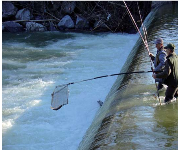
Kameradschaft beim gemeinsamen Fischen wird sehr gepflegt.