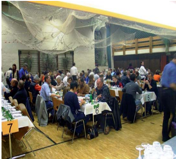
Das Fischessen ist der grösste Vereinsanlass