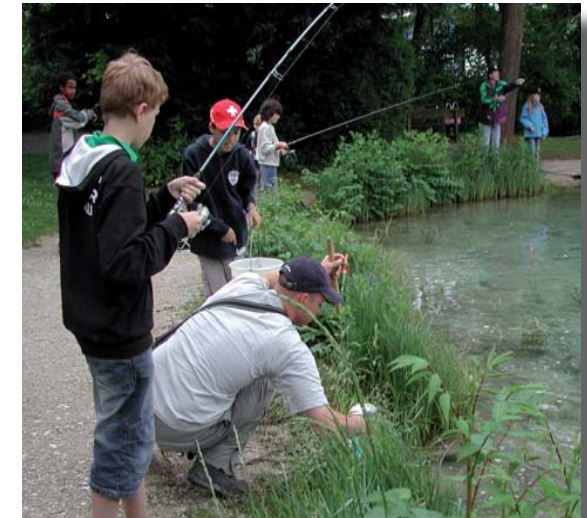
Jungfischer und Anfänger werden im Fischereigrundkurs von erfahrenen und ausgebildeten Fischern aus dem Verein ausgebildet und auf die Fischereiprüfung vorbereitet.