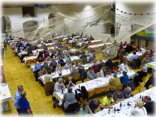
Das Fischessen ist der grösste Vereinsanlass.