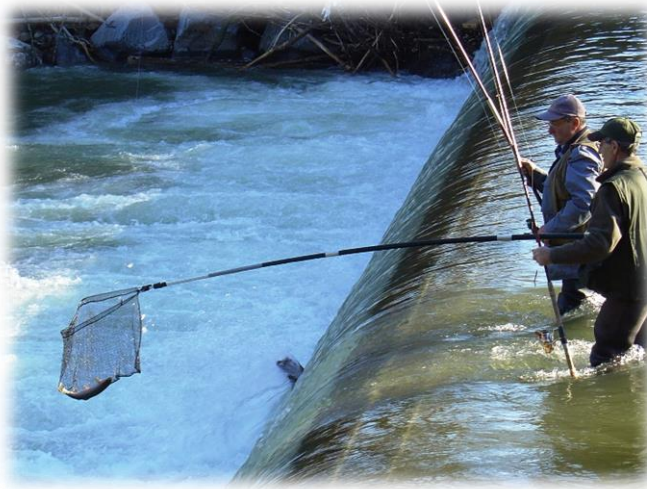
Kameradschaft beim gemeinsamen Fischen wird sehr grossgeschrieben.