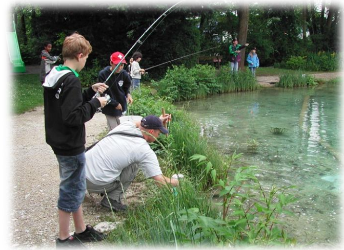
Jungfischer und Anfänger werden im Fischereigrundkurs von erfahrenen und ausgebildeten Fischern aus dem Verein ausgebildet und auf die Fischereiprüfung vorbereitet.